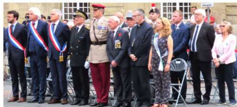
Autorités civiles et militaires