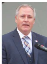
L'Honorable Glen SAVOIE Ministre de la Francophonie et des gouvernements locaux du Nouveau Brunswick