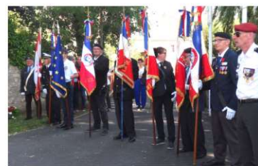
Présence de 17 Porte drapeaux