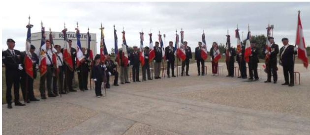
Présence de 21 Porte drapeaux