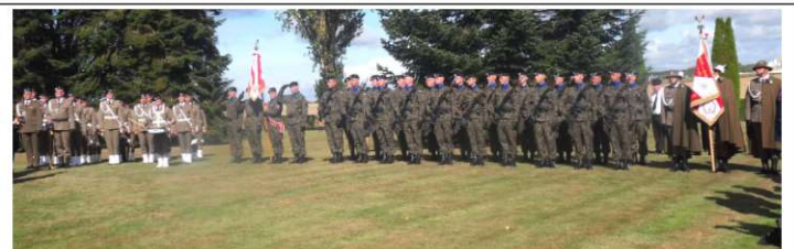
Musiciens et militaires polonais