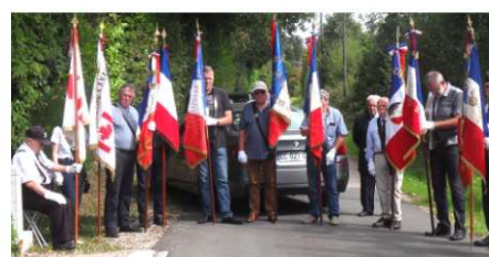
Présence de 27 Porte drapeaux