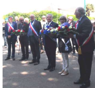
Dépôt de gerbes devant la stèle Hell's Corner