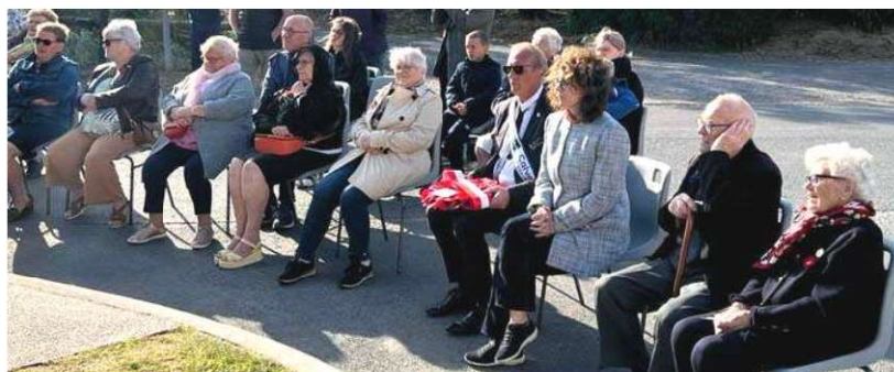
Hommage aux soldats Canadiens