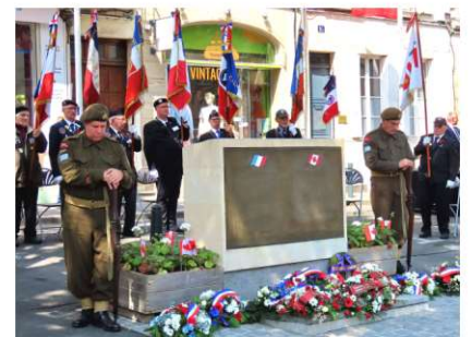
Stèle des Canadiens