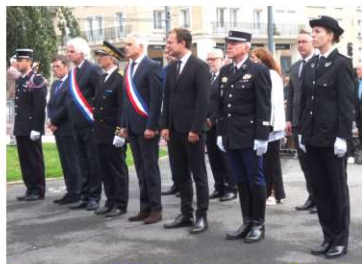
Personnalités civiles et militaires Hommage aux justes de France