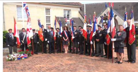
Présence de 18 Porte drapeaux