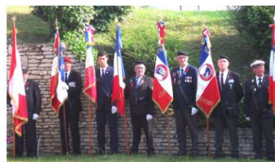
Présence de 7 porte drapeaux