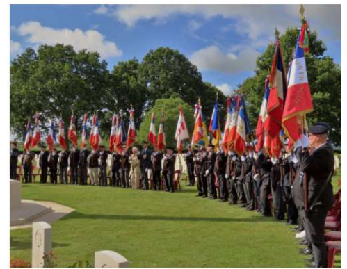
Présence de 42 Porte drapeaux