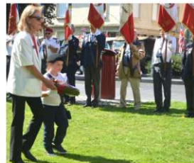
Dépôt de gerbe en hommage aux libérateurs