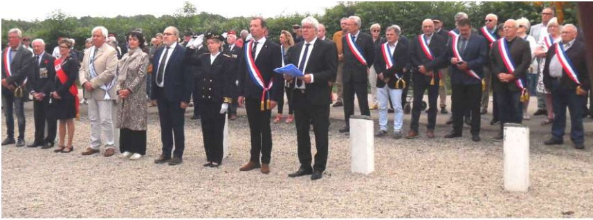
Autorités civiles et militaires au monument St-Clair