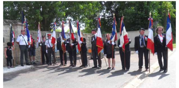
Présence de 21 porte drapeaux