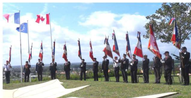
Présence de 15 Porte-drapeaux