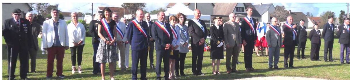
Bernières-sur-Mer samedi 12 août 2023