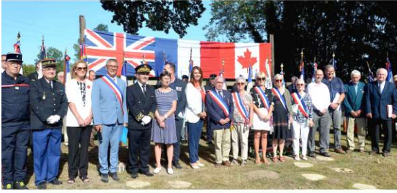
Hommage aux libérateurs Canadiens