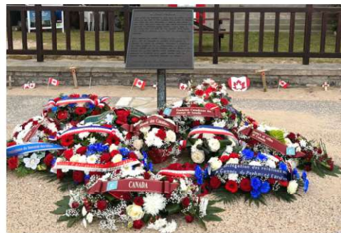
Cérémonie en hommage au Queen's Own Rifles of Canada