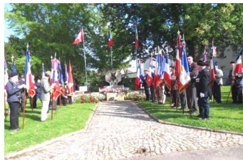
Présence de 19 Porte-drapeaux