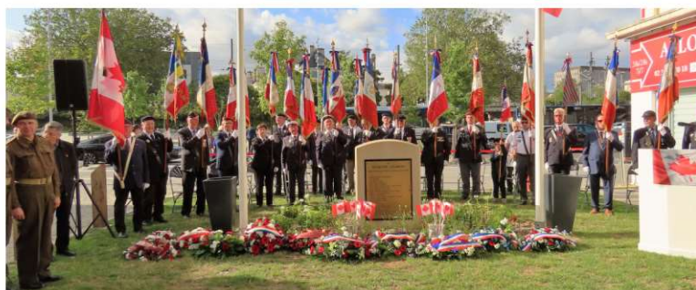
Présence de 20 Porte drapeaux