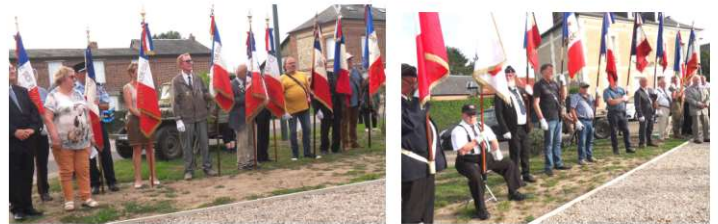
Présence de 20 Porte drapeaux