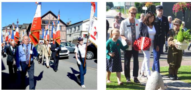
Dépôt de gerbe devant la stèle canadienne