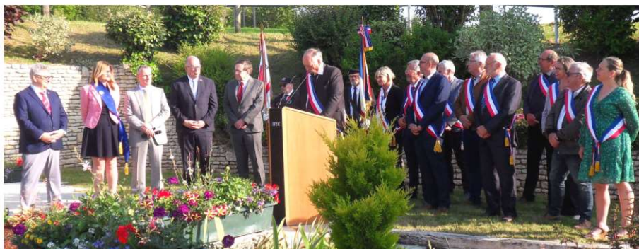
Présence d'autorités civiles et militaires