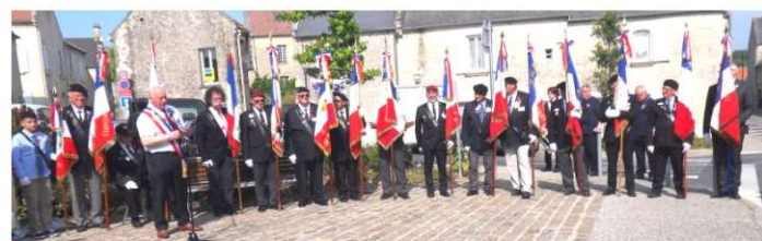
Présence de 33 porte drapeaux