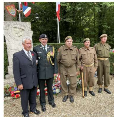
Hommage aux libérateurs Canadiens