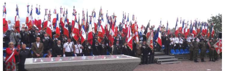
Présence de 75 Porte drapeaux