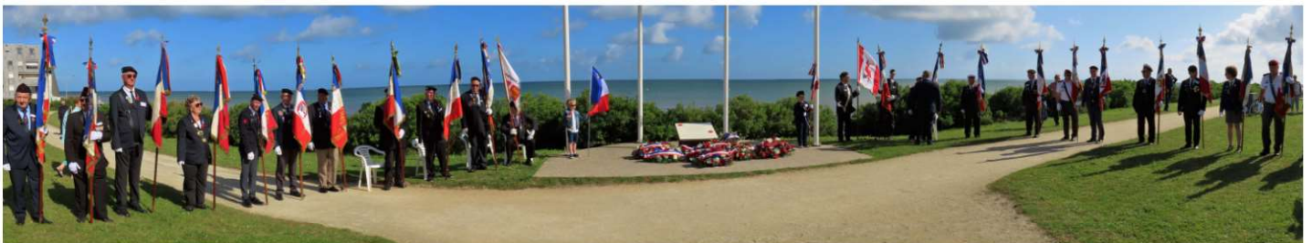
Présence de 24 Porte drapeaux