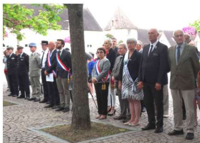
Autorités civiles et militaires