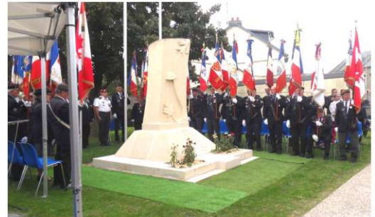
Présence de 33 porte drapeaux