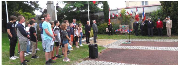
Hommage aux soldats Canadiens