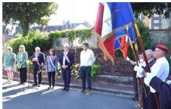
Hommage aux Canadiens