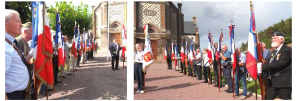
Présence de 27 Porte drapeaux