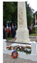
Dépôt de gerbes en hommage aux Canadiens