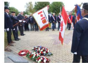
L'Assemblée Générale a été précédée d'une cérémonie avec dépôt de gerbes au monument canadien