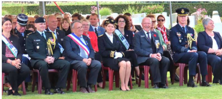
Présence d'autorités civiles et militaires