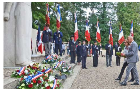
Hommage aux libérateurs Canadiens