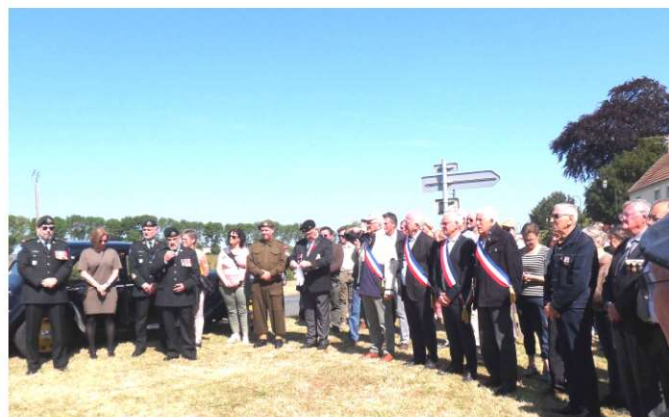
Autorités civiles et militaires