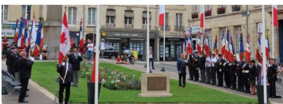
Présence de 27 Porte drapeaux