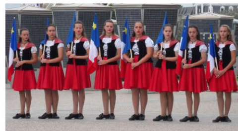
La troupe de danse « La baie en joie »