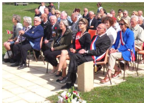
Autorités civiles et militaires