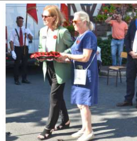
Hommage aux libérateurs Canadiens