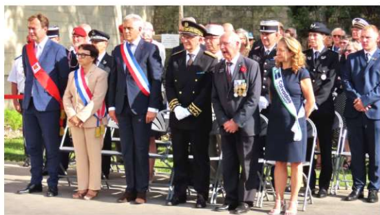
Autorités civiles et militaires