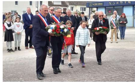
Dépôt de gerbes devant la stèle canadienne