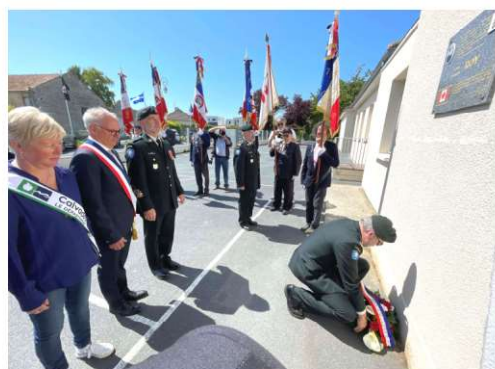
Dépôt de gerbe devant la plaque