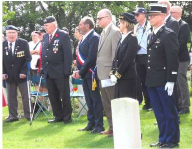
Personnalités civiles et militaires