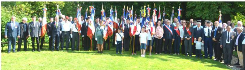
Personnalités civiles et militaires - porte drapeaux