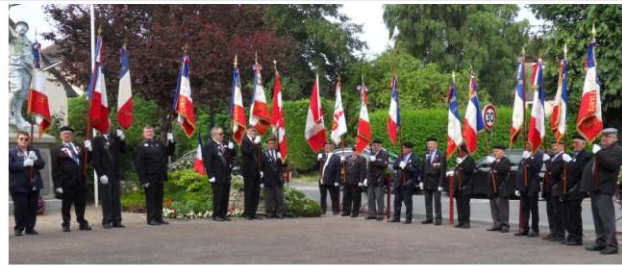
Présence de 19 porte drapeaux