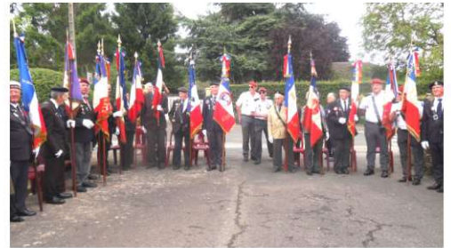
Présence de 20 Porte drapeaux