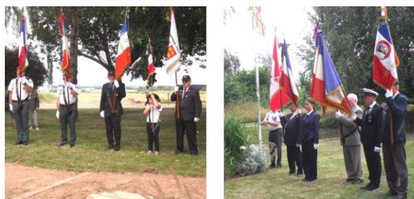
Présence de 10 Porte drapeaux