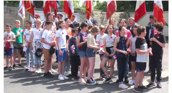
Participation des enfants