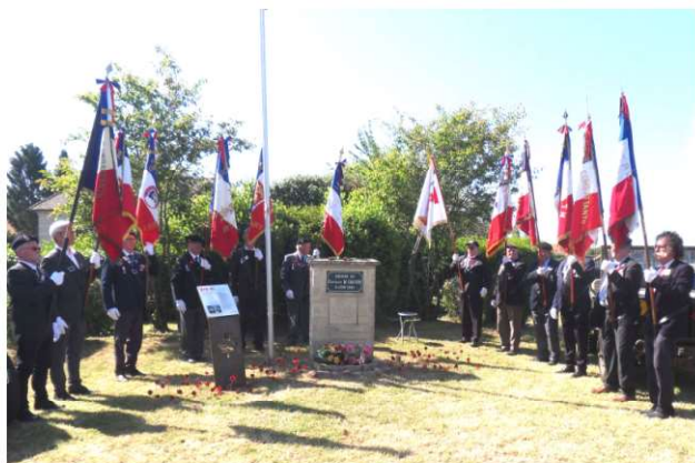
Présence de 10 porte drapeaux