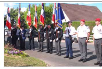
Présence de 17 Porte drapeaux