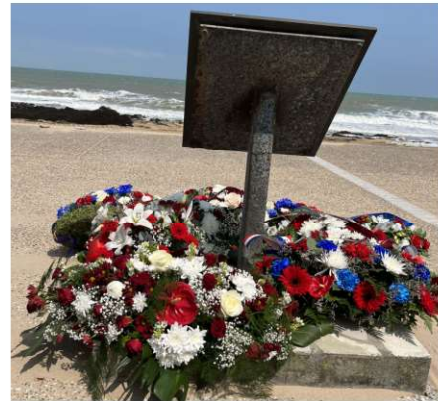
Cérémonie en hommage au Queen's Own Rifles of Canada