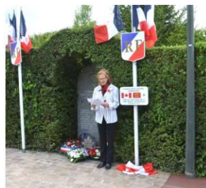
Hommage aux libérateurs Canadiens