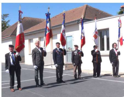
Présence de 10 porte drapeaux