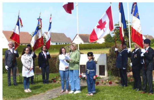
Hommage aux soldats Canadiens