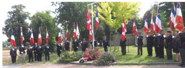
Présence de 19 Porte drapeaux