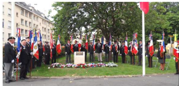
Présence de 21 Porte drapeaux