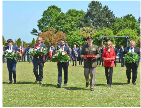
Dépôt de gerbes par les autorités civiles et militaires au Jardin britannique du Souvenir au Mémorial de Caen