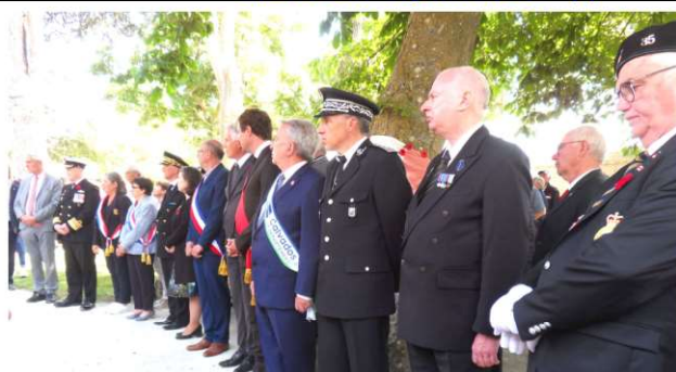
Hommage aux fusiliers canadiens