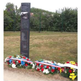
Hommage aux 17 victimes civiles