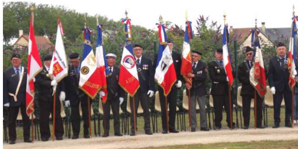
Présence de 10 Porte drapeaux