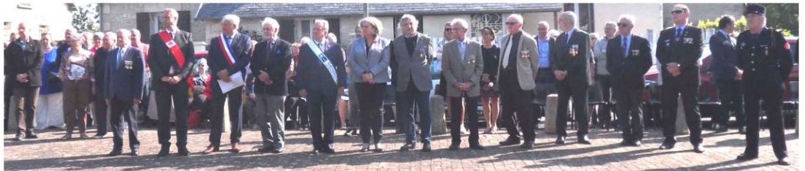
Autorités civiles et militaires