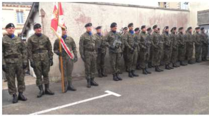
Soldats et musiciens polonais