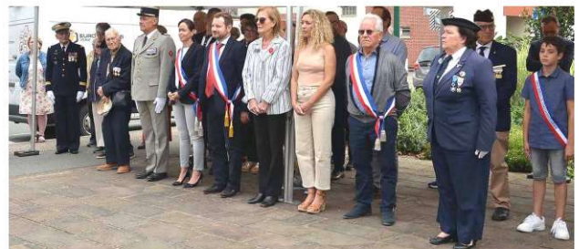
Hommage aux Canadiens