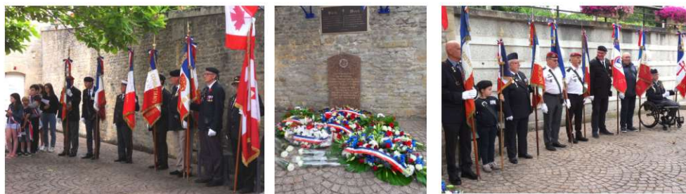
Présence de 15 Porte drapeaux