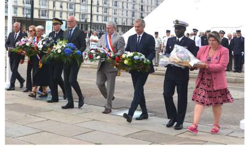
Hommage aux libérateurs Canadiens