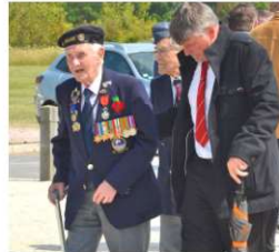
Hommage aux soldats britanniques