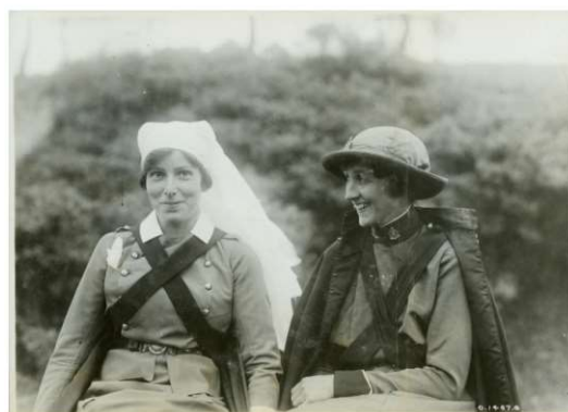
Infirmières militaires canadiennes 1914-1918

1914-1918 : Premières femmes à servir au sein du Corps de santé royal canadien. Sur les 2 845 infirmières militaires canadiennes qui ont servi pendant la Première Guerre mondiale, 58 sont mortes suite aux combats, de maladies ou noyades. Le 27 juin 1918, un sous-marin allemand torpille et coule le navire-hôpital canadien, le Llandovery Castle , les 14 infirmières à bord disparaissent.