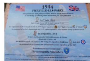
Stèle des aviateurs