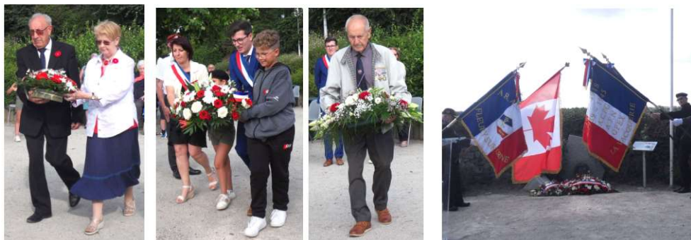
Dépôt de gerbes devant la stèle des Canadiens