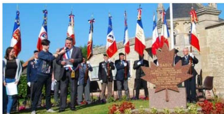
M. le Maire Yves GAUQUELIN rend hommage aux Canadiens