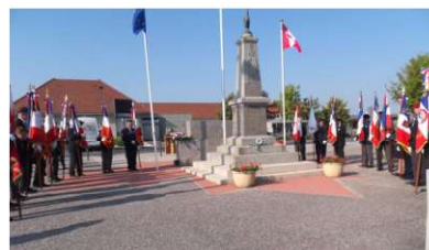
Présence de 18 porte drapeaux