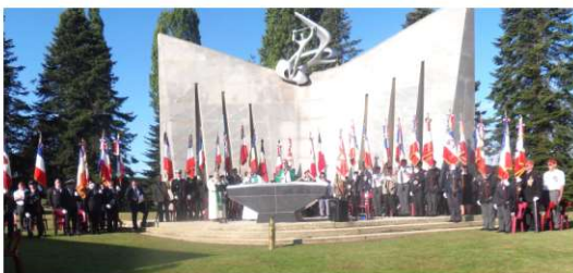
Messe célébrée en plein air en hommage aux soldats polonais Présence de 34 Porte drapeaux