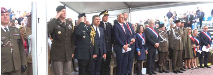
Personnalités civiles et militaires