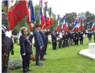
Présence de 23 Porte drapeaux