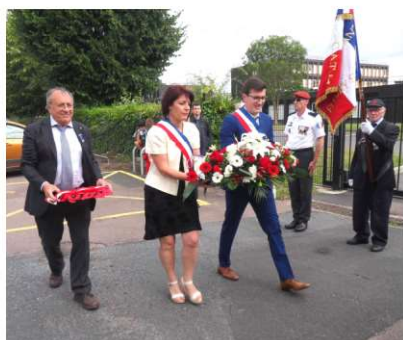
Dépôt de gerbes devant la stèle