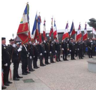
Présence de 12 Porte drapeaux