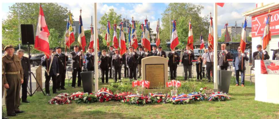
Caen rive droite rue d'auge mercredi 17 juillet 2023

79 ème ANNÉE ANNIVERSAIRE DU DÉBARQUEMENT