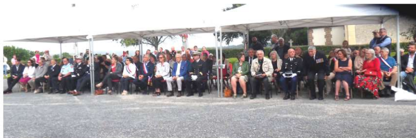
Autorités civiles et militaires