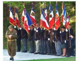
Présence de 22 Porte drapeaux