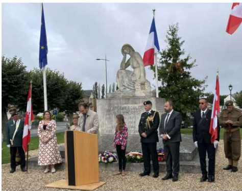
Hommage aux libérateurs Canadiens