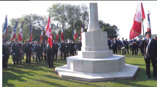
Présence de 22 Porte drapeaux