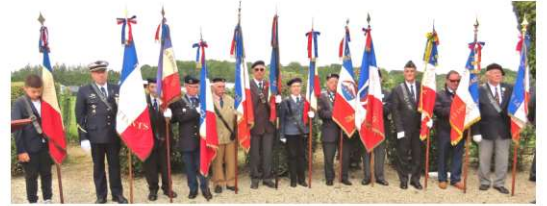
Présence de 30 Porte drapeaux