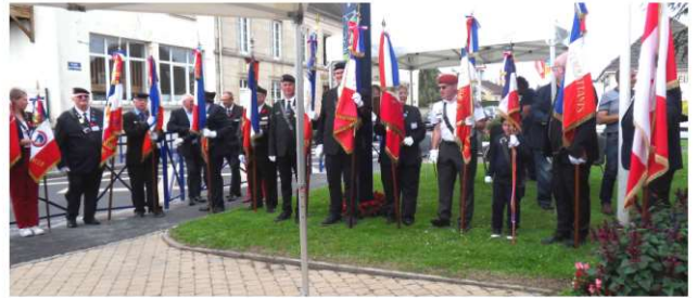
Présence de 23 Porte-drapeaux