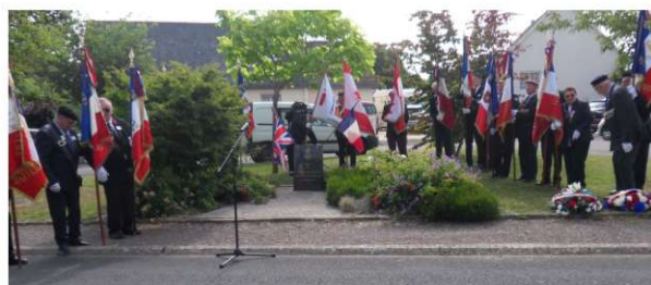
Présence de 19 porte drapeaux