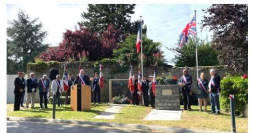
Hommage aux soldats Britanniques