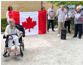
Hommage aux vingt Canadiens assassinés